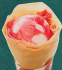
strawberry ice cream and strawberry sauce いちごアイス ¥580