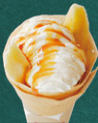
caramel banana with whipped cream キャラメルバナナホイップ ¥620