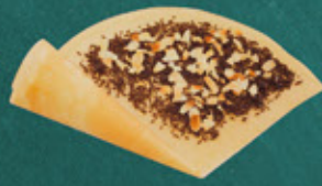
chocolate and almond アーモンドチョコ ¥500