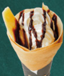
chocolate banana with whipped cream チョコバナナホイップ ¥620