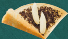
chocolate and banana チョコとバナナ ¥550