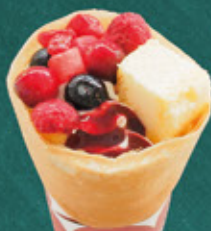
mix berry whipped cream with cheese cake ベリー&チーズケーキ ¥750