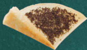
chocolate チョコ ¥400