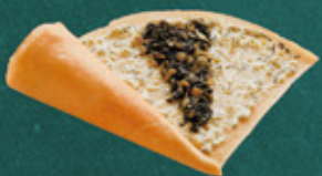
nozawana tartar sauce 野沢菜タルタルソース ¥500