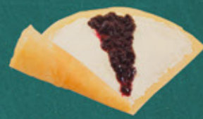
blueberry jam and cream cheese ブルーベリージャムと クリームチーズ ¥700