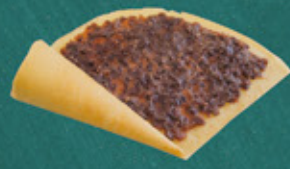
anko(sweet bean paste) つぶあん ¥430