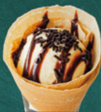
chocolate and ice cream チョコとバニラアイス ¥580