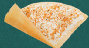
shichimi spices sesame and cream cheese 七味ごまとクリームチーズ ¥700