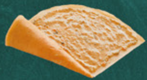
miso tartar sauce みそタルタルソース ¥450