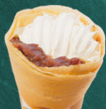
anko(sweet bean paste) and whipped cream つぶあんホイップ ¥550