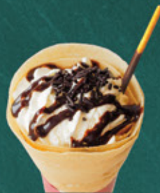
chocolate and whipped cream チョコとホイップ ¥530