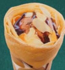
chocolate ice cream and almond アーモンドとチョコアイス ¥650